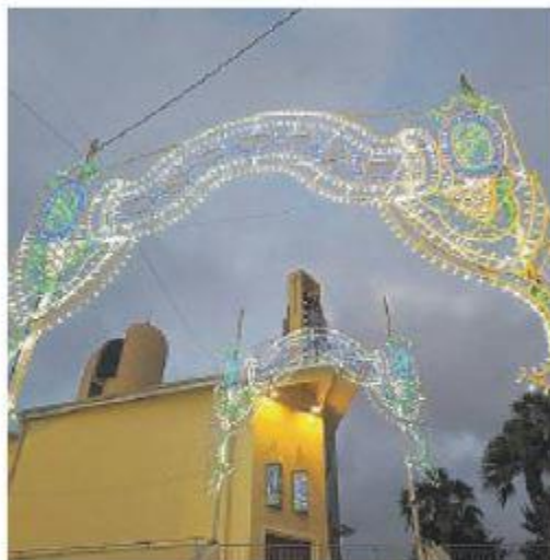
Luminarie accese vicino alla chiesa